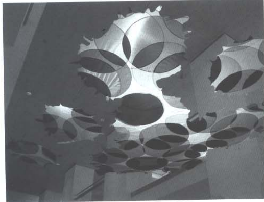
cromografía © Santiago Borja