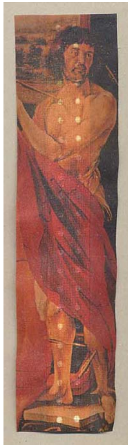
Miguel Rothchild / «Saint Sébastien», 1996 / Tirage sur sparadrap / 81 x 16 cm