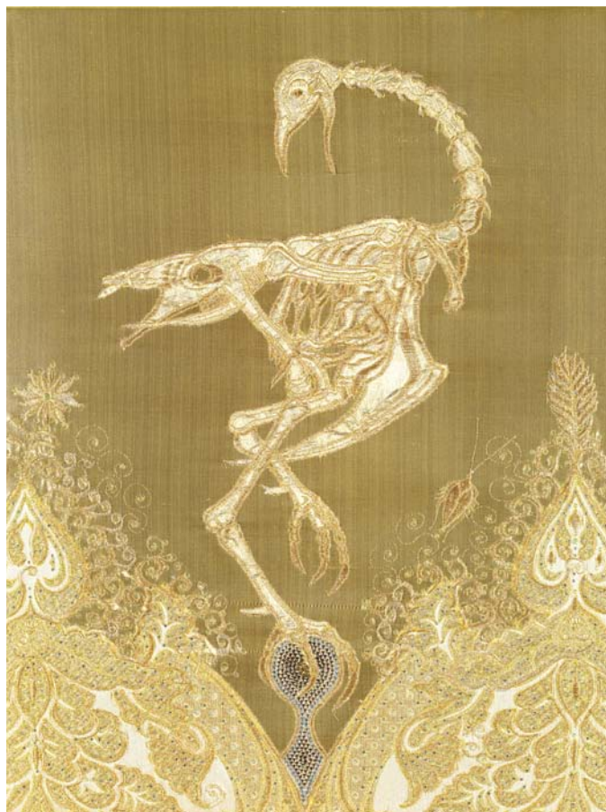
Angelo Filomeno / «Arcanum : Danse of cocks», 2006 / Broderie sur soie, cristaux et fil d'or / Pièce unique / 54 x 41 cm