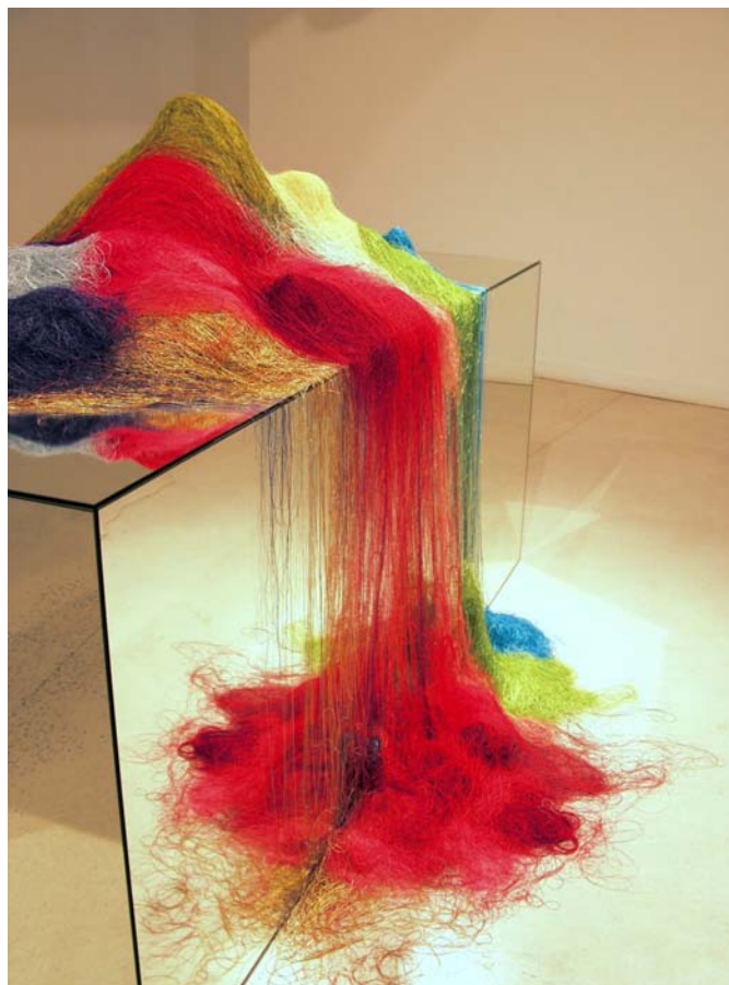
Julie Legrand / «Rose», 2007 / Fil à coudre polyester sur parallélépipède en miroir / 1,90 x 0,82 m / Hauteur des tas de fil : de 3 à 43 cm / Envergure : 2,25 m Coproduction Château d'O, Domaine d'art du Conseil Général de l'Hérault, Montpellier