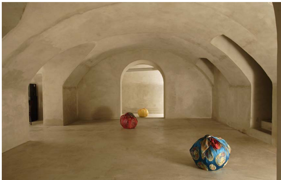
Kimsooja / «Bottaris», 2005 / Installation de 3 Bottaris / Ballots de textiles / H: 53 cm, diam: 70 cm / Exposition Kimsooja - Bottari Cologne, Kewenig Galerie, Cologne, 2005.