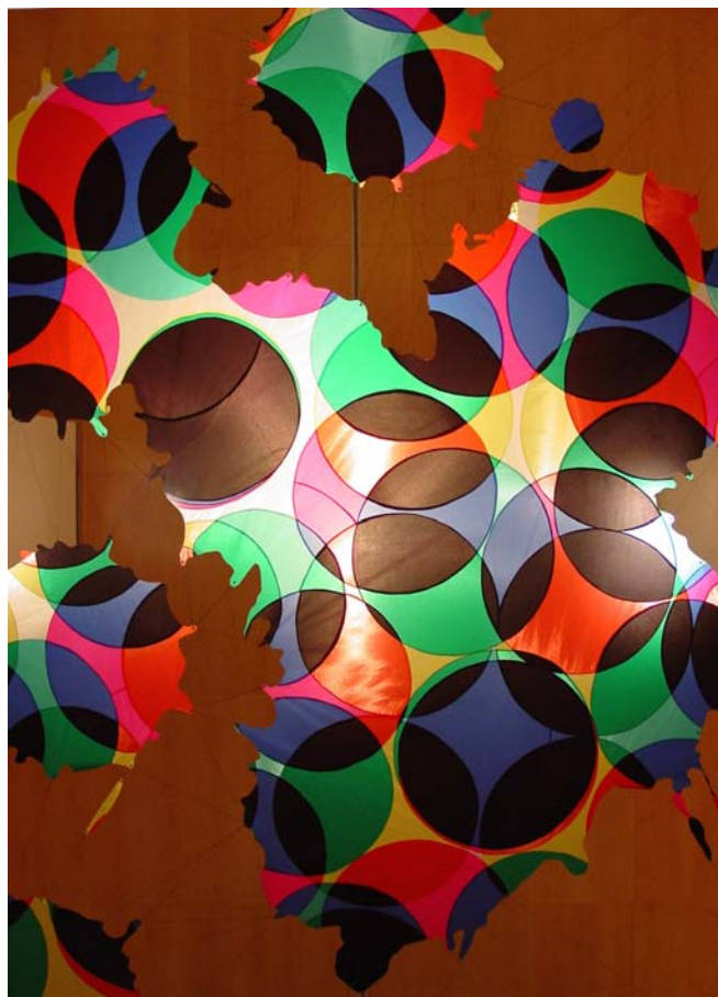
Santiago Borja / «Cromografía», 2007 / Toile de nylon enduction polyuréthane / 3,40 X 3,60 m / Fondation Marcelino Botín, Santander, Espagne.