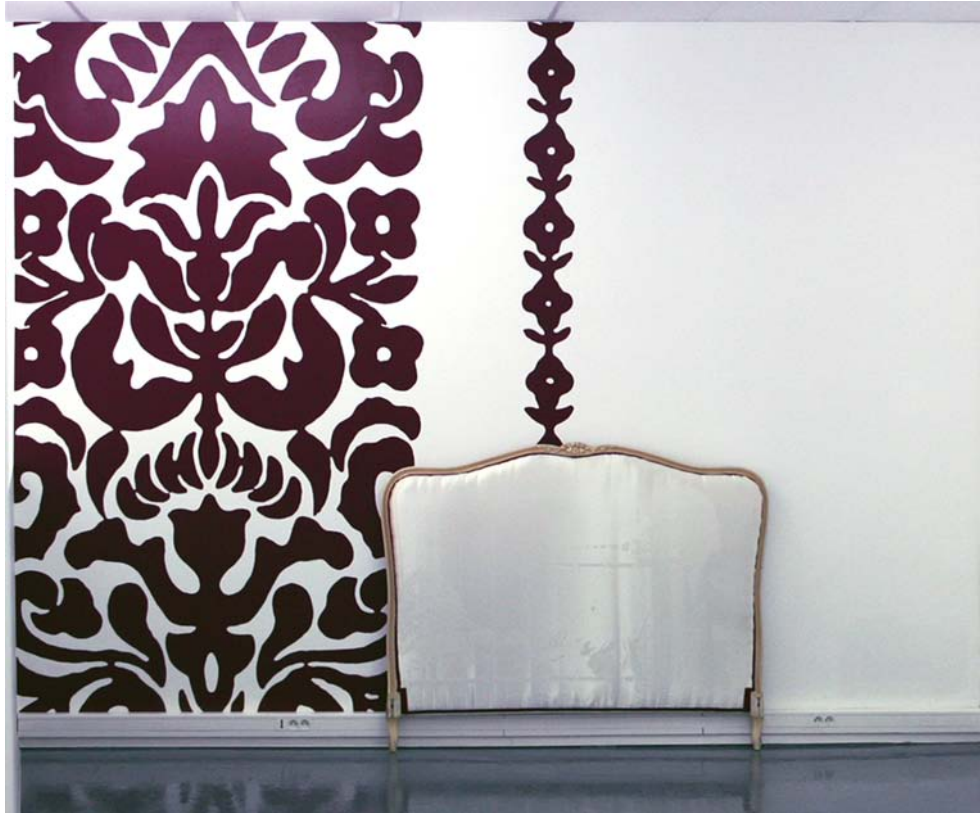
Aïcha Hamu / «Sophia Scicolone», 2007 / Usure sur satin sur tête de lit sur wallpainting / Dimensions variables Exposition Attitude de croisière, VF Galerie, Marseille. / Courtesy : Galerie VF, Marseille; Galerie Catherine Issert, Saint-Paul