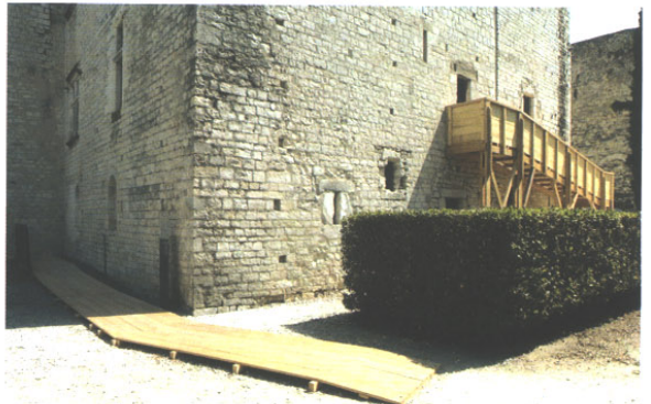
Tadashi Kawamata, Vues après intervention sur le Château des Adhémar, 2005. ©Tadashi Kawamata. ©Centre d'art contemporain du Château des Adhémar.