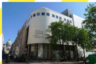
Façade extérieure, angle des rues d'Ulm et Erasme